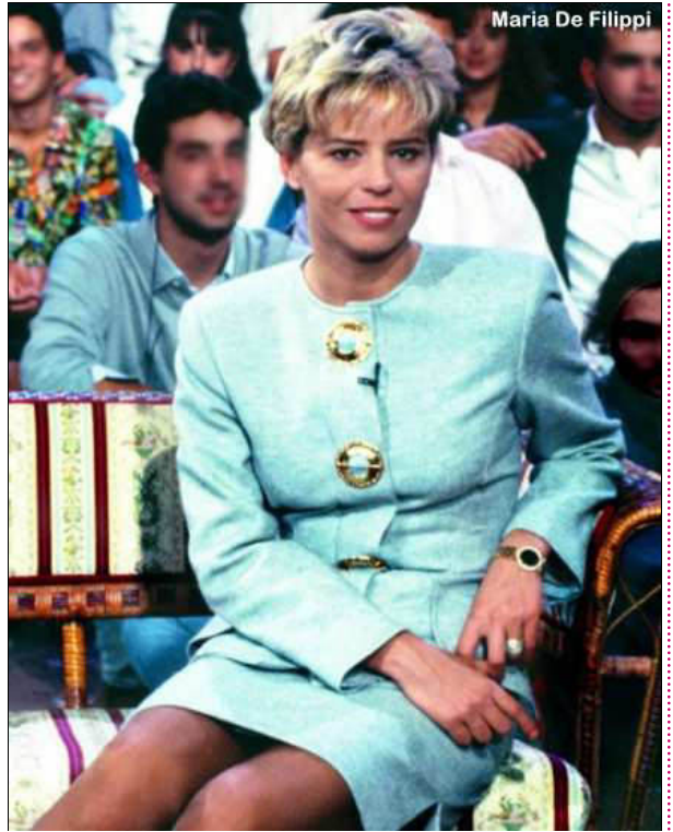
Maria De Filippi

Il talk show Amici viene dunque mandato in 'pensione' da Mediaset, che lo riproporrà, con scarso successo, tra il 2000 e il 2001. Ma quel titolo verrà ben presto rispolverato nel 2003 quando la conduttrice, dal 1995 signora Costanzo , si vedrà costretta dal copyright a cambiare nome alla sua nuova creatura, quel 'Saranno famosi' che sarebbe diventato per Canale 5 una vera e propria miniera d'oro, fulcra di nuovi talenti con la denominazione Amici di Maria De Filippi , giunto quest'anno alla dodicesima edizione.