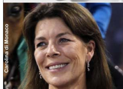
Carolina di Monaco