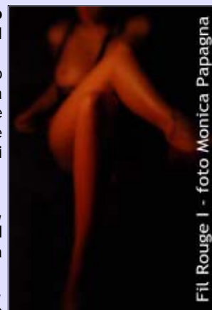
Fil Rouge I - foto Monica Papagna