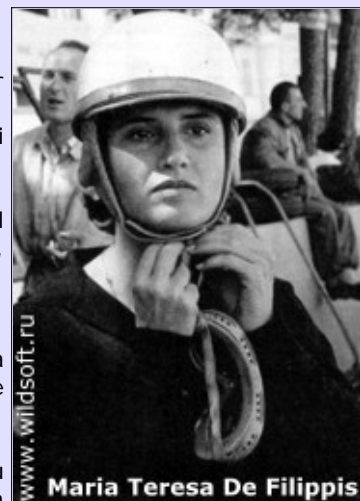
Maria Teresa De Filippis