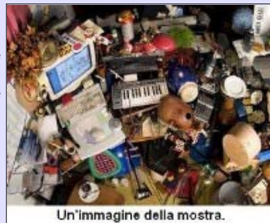
Un'immagine della mostra.