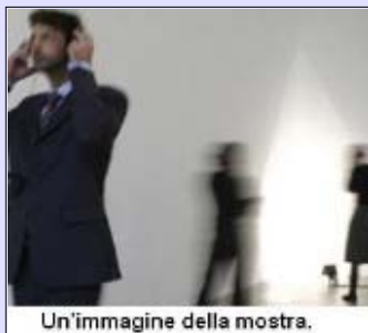
Un'immagine della mostra.

Il visitatore è invitato a isolarsi acusticamente e a concentrarsi su specifiche sensazioni uditive . Il particolare allestimento permette di muoversi in uno spazio espositivo apparentemente silenzioso , ma in realtà invaso da molteplici fonti sonore . E tuttavia, non ci troviamo davanti a pure emanazioni acustiche: le fonti rimangono esplicite e visibili, il referente è al centro della narrazione.