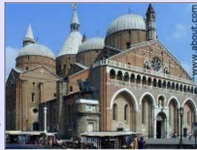
Padova, basilica di Sant'Antonio